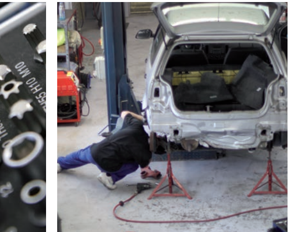
Für die Unfallinstandsetzung finden Sie bei uns alles unter einem Dach – bis hin zur modernen Lackierkabine mit computergesteuerter Mischanlage.