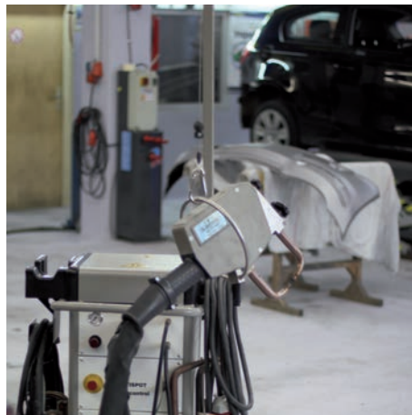
Alles für den perfekten Rundum-Service: moderne Ausstattung, erfahrene Mitarbeiter, gute Organisation

„Über die S-CAR-Service als Partner können wir die gesamte Instandsetzung von Unfallwagen unter einem Dach abwickeln – inklusive Gutachten.“