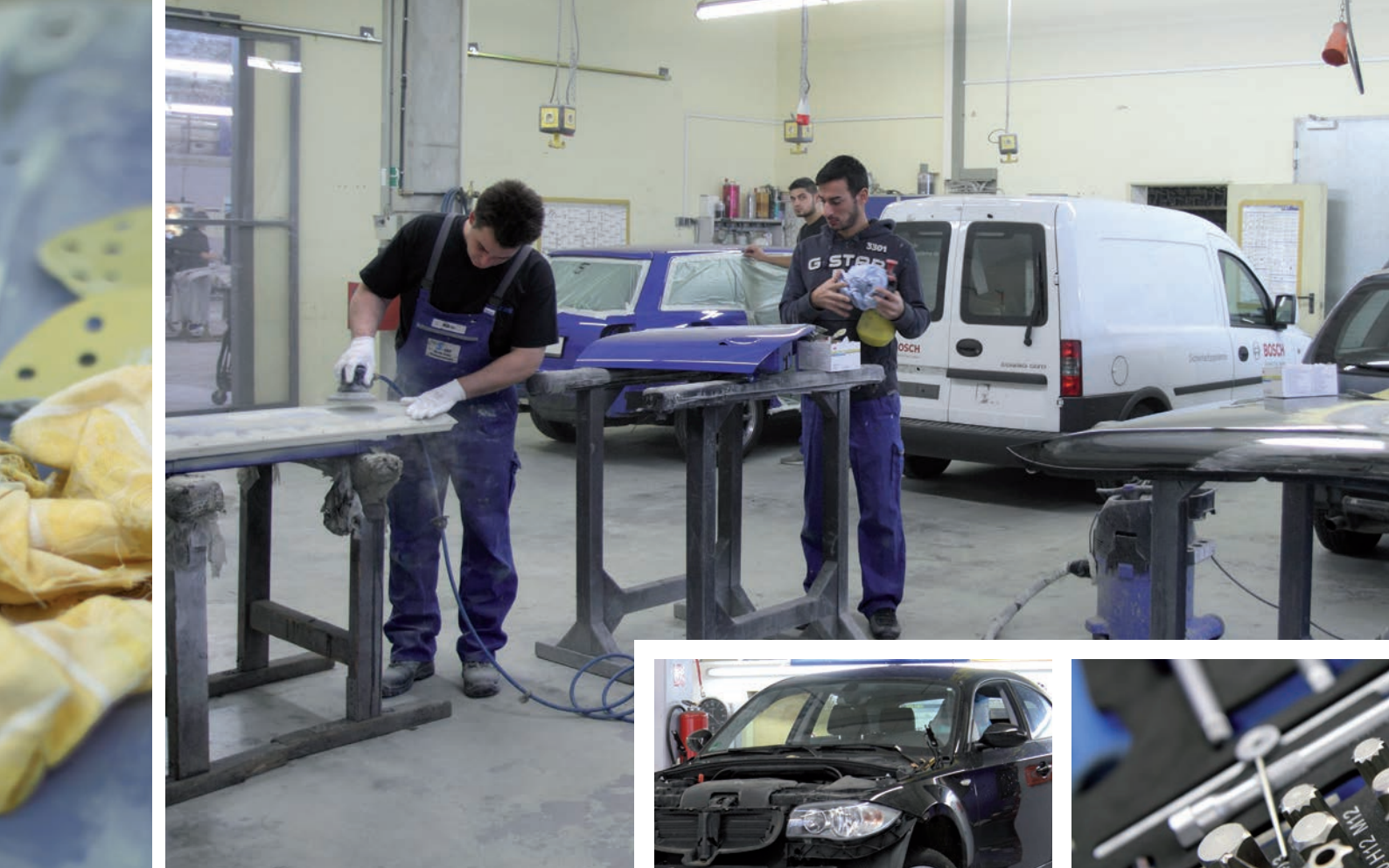
Sorgfalt bis zum letzten Schliff: die Instandsetzung von Unfallwagen in eigener Spenglerei.